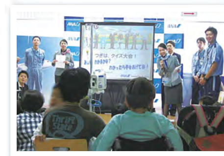
客室乗務員や航空整備士などスタッフによるクイズ大会

また、9月4日に小児医療センター(こどもの森)で航空教室を、9月24日には大学病院について広く市民に知ってもらうことを目的に病院見学会が開催されました。