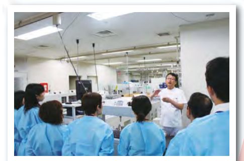
臨床検査部で説明を受ける見学者