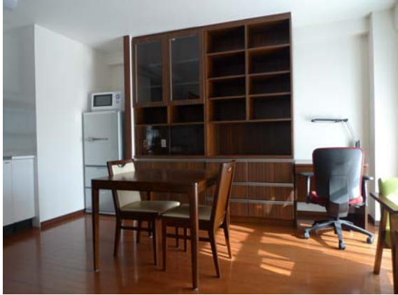
リビング・ダイニング Living/Dining Room

リビング・ダイニングと寝室が分かれた1人から2人用のお部屋です。ベッドはダブルベッドです。 A bedroom with a separated living/dining room and bedroom designed for one to two occupants. The bed is a double bed.