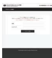
申請アカウント発行

ご応募はオンライン申請システムからのみの受付となります。右記URLより2023年度募集要項をご確認いただき、同ページ内の「申請アカウント発行」ボタンから期日までにお手続きください。