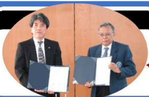
◆インドネシアバンドン工科大学との調印式