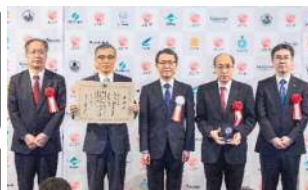
※オープンイノベーション大賞授賞式

第1回日本オープンイノベーション大賞（文部科学大臣賞）受賞（「基礎研究段階からの産学共創～組織対組織の連携～」）