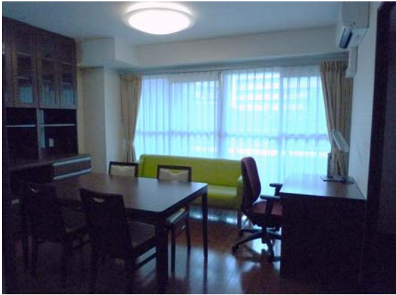
リビング・ダイニング Living/Dining Room

A room with a living/dining room and two bedrooms designed for two to four people. The beds are a double bed in the main bedroom and a stacking bed in the sub-bedroom.