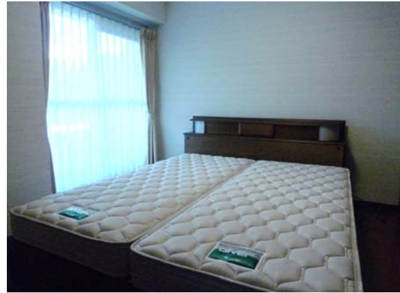
主寝室 Main Bedroom