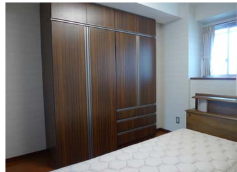
主寝室内の収納 Closet inside the main bedroom