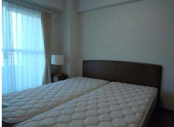
主寝室 Main Bedroom