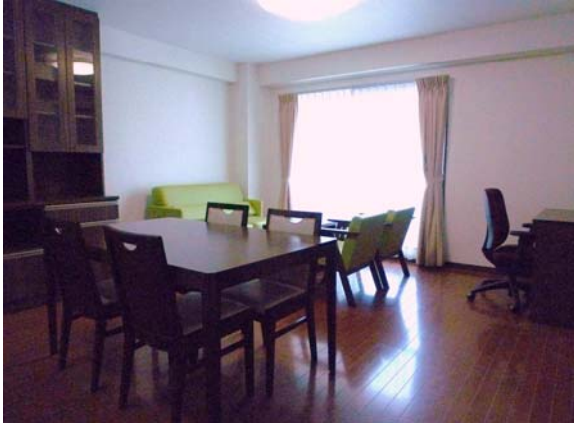
リビング・ダイニング Living/Dining Room

A room with a living/dining room and two bedrooms designed for two to four people. The beds are a double bed in the main bedroom and a single bed in the sub-bedroom. In the case you will move in with 4 people, you may use the sofa bed in the living room.