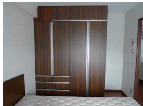
主寝室内の収納 Closet inside the main bedroom