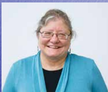
ヴィヴィアン＝リー・ニートレイ UCEAP本部代表

UCEAPは大阪大学の協調精神、豊中キャンパスでのオフィス開設への尽力、そして私達の教員・学生が受けている多様なサポートに感謝しております。私達の側からもUCEAPが提供する多くのプログラムにお迎えしたいと考えております。UCEAPと大阪大学が築いた確固たる関係を基に、これからも共に歩んで行きましょう。