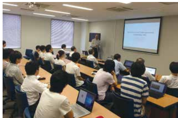
UC教員による大阪大学での授業