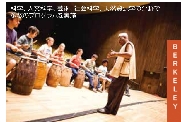
科学、人文科学、芸術、社会科学、天然資源学の分野で多数のプログラムを実施