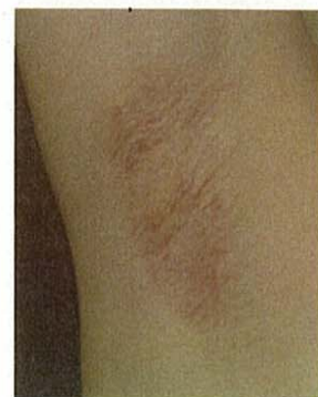
図2 脱毛後に色素沈着が残った例(女性:わき)