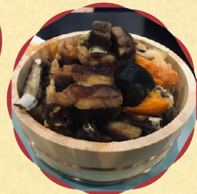
ホルホグ (石焼骨付き羊肉)