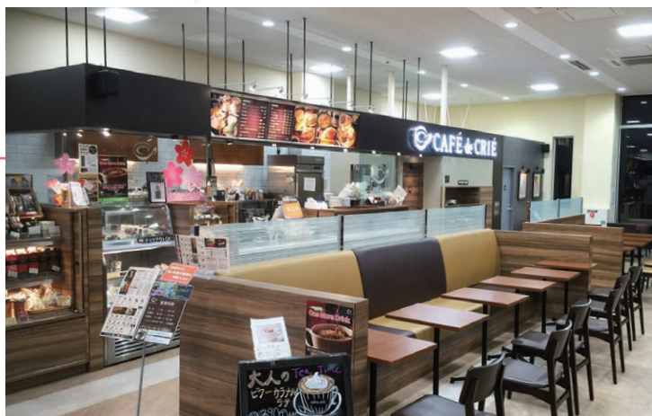
歯学部附属病院内カフェ CAFÉ de CRIÉ

専門的な知識なんていません。必要なのは、好奇心と、ゆっくりおしゃべりを楽しむ気持ち。美味しい飲み物とお菓子をお供に、夕方のひとときを一緒に楽しみましょう。