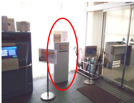
【吹田キャンパス】 ICホール1階 吹田学生センター前 (証明書自動発行機のとおり)

※学内提出BOXに提出する書類が『採用候補者決定通知(進学先提出用)』1枚のみの場合は、封筒やファイルへの封入は不要です。『入増の申告書』や『進学前離職証明書』など複数の書類を提出する必要がある場合は、各自で用意した封筒に封入して投函してください。