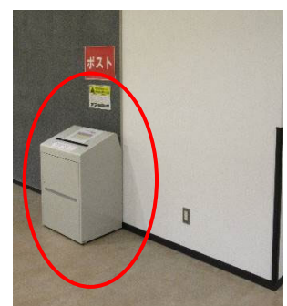
【箕面キャンパス】 外国語学研究講義棟2階 就職情報コーナー横 (西側階段あがってすぐ)