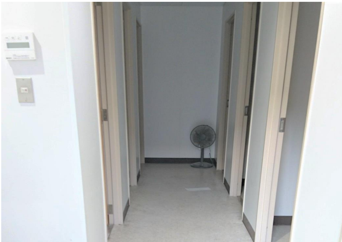
【シャワー室 Shower room (7室 7room)】