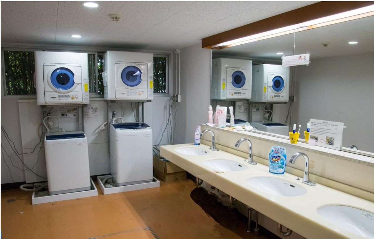
【洗濯室 Laundry room】