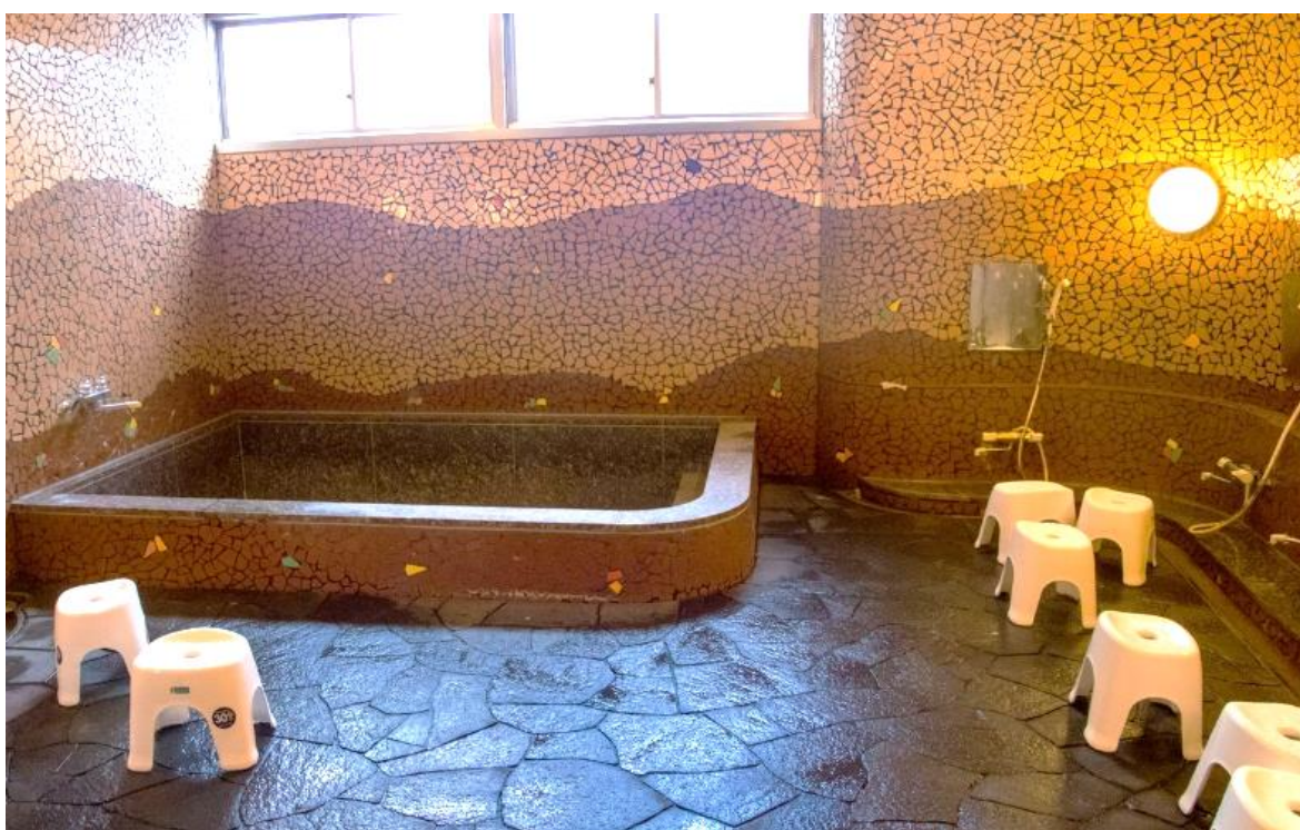
【共用風呂 Shared bath】