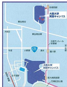
◀箕面キャンパスの周辺図