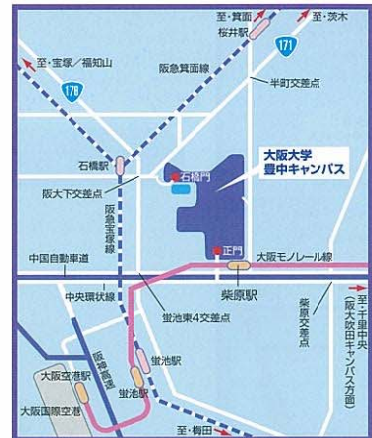
▲豊中キャンパスの周辺図