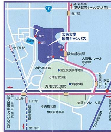
▲吹田キャンパスの周辺図