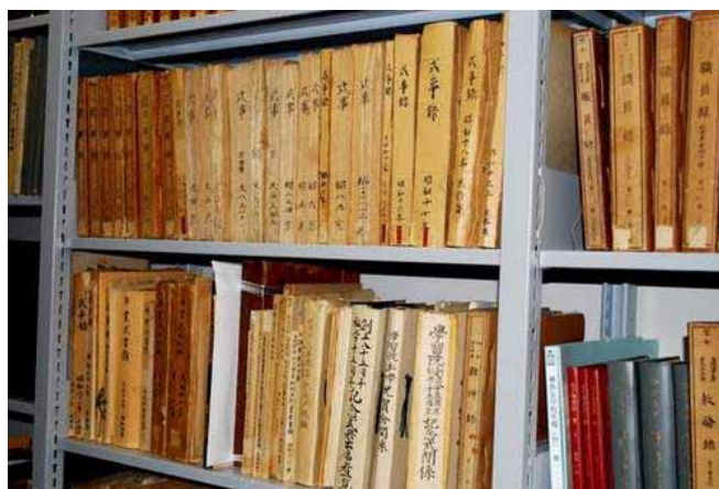
学習院アーカイブズ準備室所蔵文書

アーカイブズの設置過程における「どこに何があるか」の明確化は、事務の効率化・収蔵スペースの有効活用につながるほか、何よりも学内の各部署間、あるいは教員と職員間の連携・情報交換を円滑にするのではないか。このことについては、資料の所在確認や各部署を回ってみて一定の手応えを感じている。学習院のキャンパスがそれほど小さくなく、あらゆる部署を気軽に訪ねることができる強みかもしれない。ともあれ筆者が重視しているのは学内および学校間における情報の共有化と交流であり、学習院という組織にとってアーカイブズとは、社会的責任や建学の精神の継承・情報公開への対応云々より以前に、あると便利だから設けるのである。ささやかな試みではあるが大学アーカイブズとしてのひとつのモデルとなれるよう、大阪大学とも情報交換を重ねながら事業を進めていきたい。