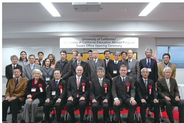
大阪オフィス開所式

カリフォルニア大学が学術交流協定を結んでいる西日本協定大学との間における学生交流を活発にするため、及び留学プログラムの企画や、カリフォルニア大学教員による大阪大学学生への授業を行うための中核拠点として、大阪大学豊中キャンパス文理融合型研究棟内に、UC/UCEAP大阪オフィスが2014年12月3日に開設されました。