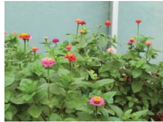
どの種よりも早々に開花した百日草