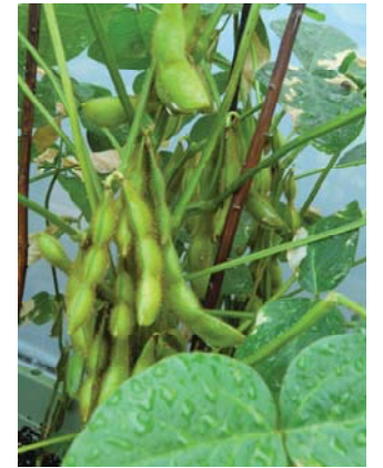
収穫まで、あと少し