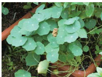
暑い夏、花は休みなので、もう少し涼しくなってからの花芽を期待しています