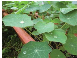
雨上がりのきんれんか