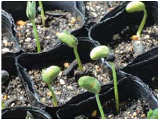
芽がすっくり首をのびした枝豆