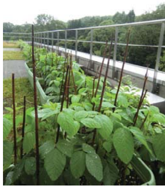
植え替え後、瑞々しい若葉が繁った枝豆 支柱にしているのは、 緑化リーダー会の方から提案のあった セイタカアワダチソウの茎を使いました