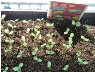
双葉が顔をだしました