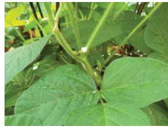
写真中心の白いものが、枝豆の花