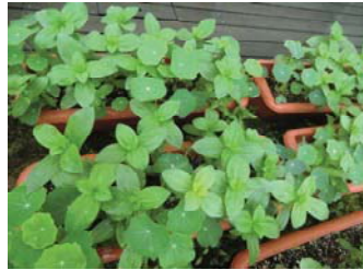
プランターに植え替え