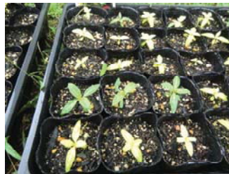
最後に出芽の日日草