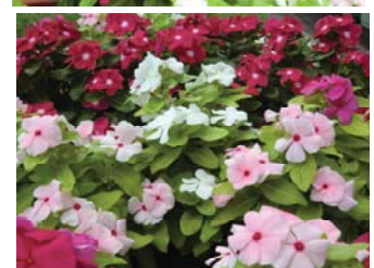
色とりどりの日日草