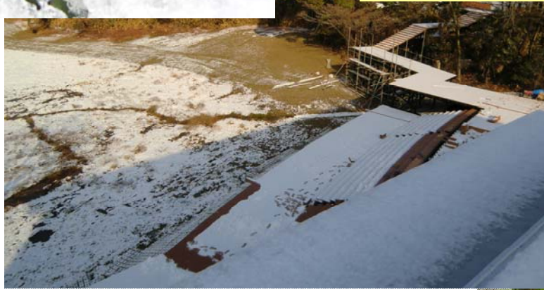
年が明けて、雪が降りました。雪化粧した中山池