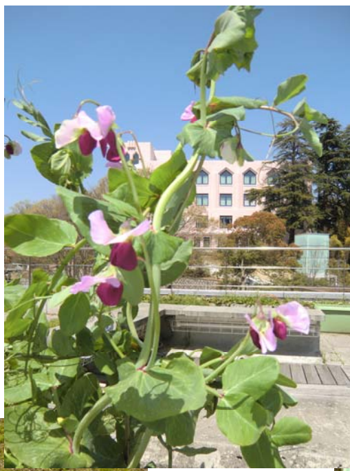
どんどん伸びて「ジャックと豆の木」 を彷彿させます