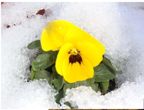
酒増の中 いち早く花を咲かせました