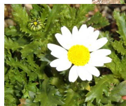
▲クリサンセマム ビオラなどとともに、冬から春、庭を飾る代表的な花