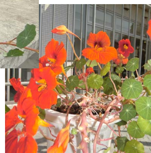
▲昨年夏、猛暑のため枯れかけていた ナスチウムに、この冬、季節はずれの 花が咲きました