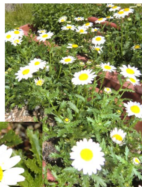
カラスにつつかれ ながら生き残りました