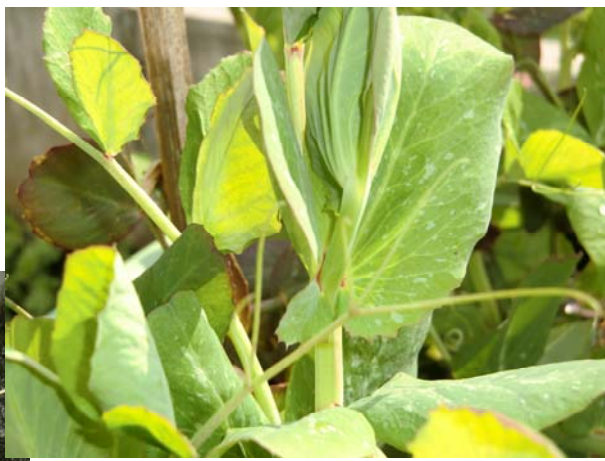
豆ご飯にすると赤紫色に……