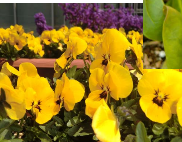
▼ビオラ 冬から春にかけて花壇を彩ります