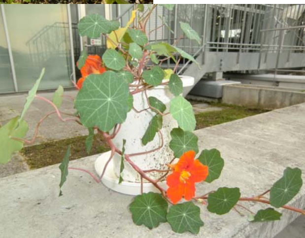
葉はわさびの味がします