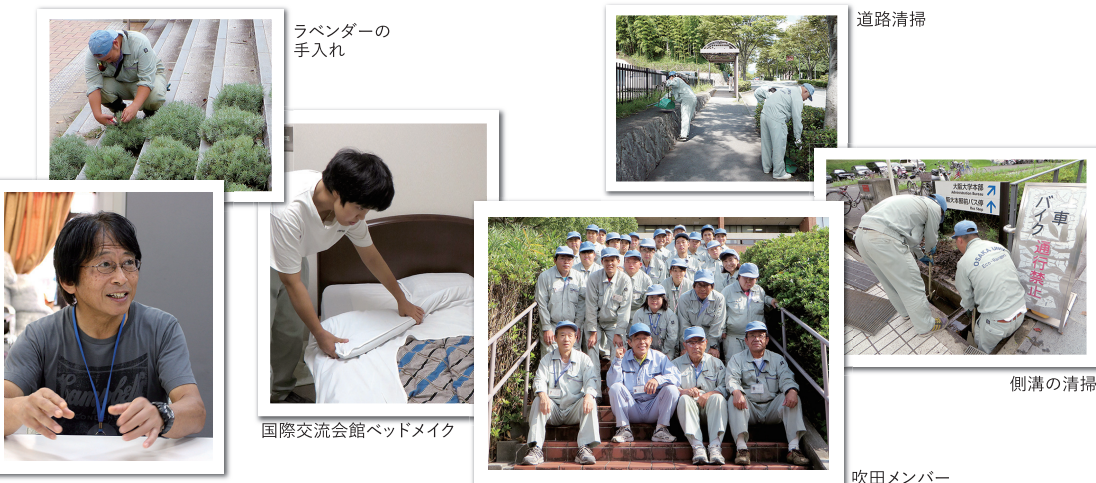
ラベンダーの手入れ

「就任当時は障害のある人との仕事は初めてで、何もかもがーから勉強の毎日でしたが、変に予備知識がなかったことで、先入観なくこの仕事に向き合うことができました。スタッフと接するときに心がけていることは、『仕事への真摯な姿勢』をメンバーに伝えること。エコ・レンジャーの仕事がボランティアではなく、お金をもらって働いているという意識をもってもらいたいからです。阪大での任期が終わったあとも、彼らが阪大で働いていた経験を次の職場で評価されるように、そのことを彼らが誇れるようになればと思っています。だから、時に厳しい言葉も飛びます(笑)。発足から5年が経ち、学内でエコ・レンジャーも広く知られるようになりました。作業姿を見かけて声をかけてくださる方が増えたことを、嬉しく思っています。」