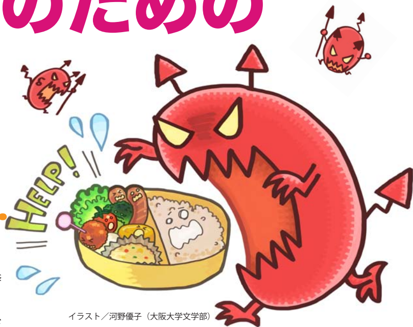
イラスト/河野優子 (大阪大学文学部)