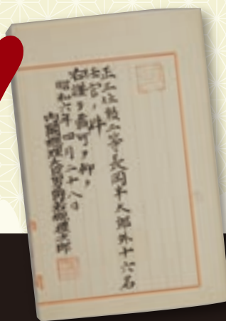
長岡半太郎が 初代大阪帝国大学総長に 任命された際の「任免裁可書」 昭和6年(1931)

教科書で学んだ歴史資料から、 “これも公文書!?”という意外なものまで… 国立公文書館が所蔵する個性豊かな公文書とともに、 大阪および大阪大学関係資料をご紹介します。